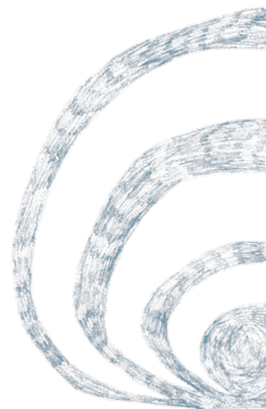
4 - D'autonomisation et de prise en charge individuelle et collective de la santé.

L'outil est accompagné du présent guide, qui servira de soutien à toute personne souhaitant se lancer dans les animations proposées. Nous précisons d'emblée que ce processus nécessite un certain temps de découverte, de préparation et de mise en œuvre. Le cadre proposé ici a été conçu afin que chacun puisse se l'approprier et l'utiliser à sa manière. Le terme « animateur » est utilisé dans l'ensemble de l'outil pour nommer le professionnel, le relais ou le bénévole qui endossera le rôle de guide dans cette réflexion collective et éducative.