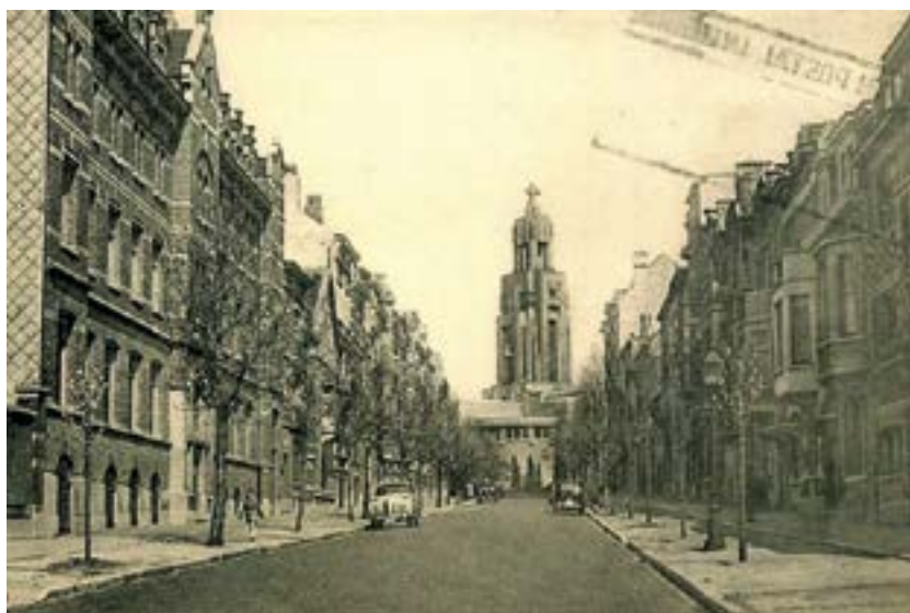
L'Altitude Cent et son église Art déco

A Forest, on parle du haut et du bas de la commune. C'est d'autant plus vrai pour cette localité, que la place de l'Altitude Cent et son église Art déco constituent le point culminant de la Région. Alternant quartiers résidentiels assez favorisés, tours d'immeubles autour de Forest-National et maisons de rangées à proximité de la place Saint-Denis, cette entité du sud-ouest de Bruxelles, bordée par le Ring et la Région flamande et jouxtant les communes d'Uccle, Ixelles, Saint-Gilles, Forest et Anderlecht, compte aujourd'hui 56.000 habitants, soit une augmentation de 16% de sa population en dix ans et une croissance des populations jeunes (+14% de jeunes entre 12 et 17 ans, +10% d'enfants en bas âge) pour lesquels les besoins en infrastructures adaptées (crèches, écoles...) se font sentir. La commune présente donc des réalités contrastées et accueille une population hétérogène sur le plan socio-économique. Mais si début des années 90, le délaissement de certains quartiers plus pauvres ont provoqué des réactions violentes de certains jeunes vis-à-vis