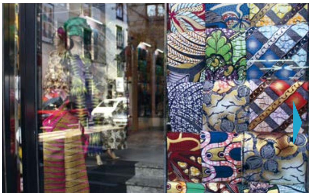
Boutiques de WAX : un des produits typiques du quartier pour confectionner pagnes, chemises, robes et accessoires.