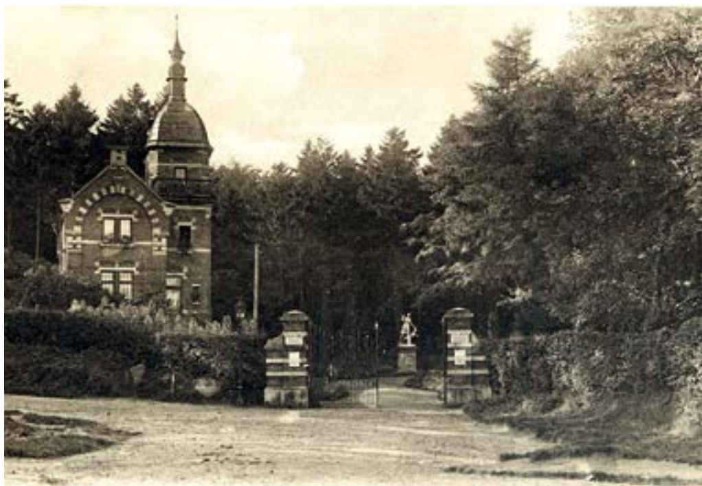
776. - BRUXELLES FOREST. - Entrée du Parc Duden