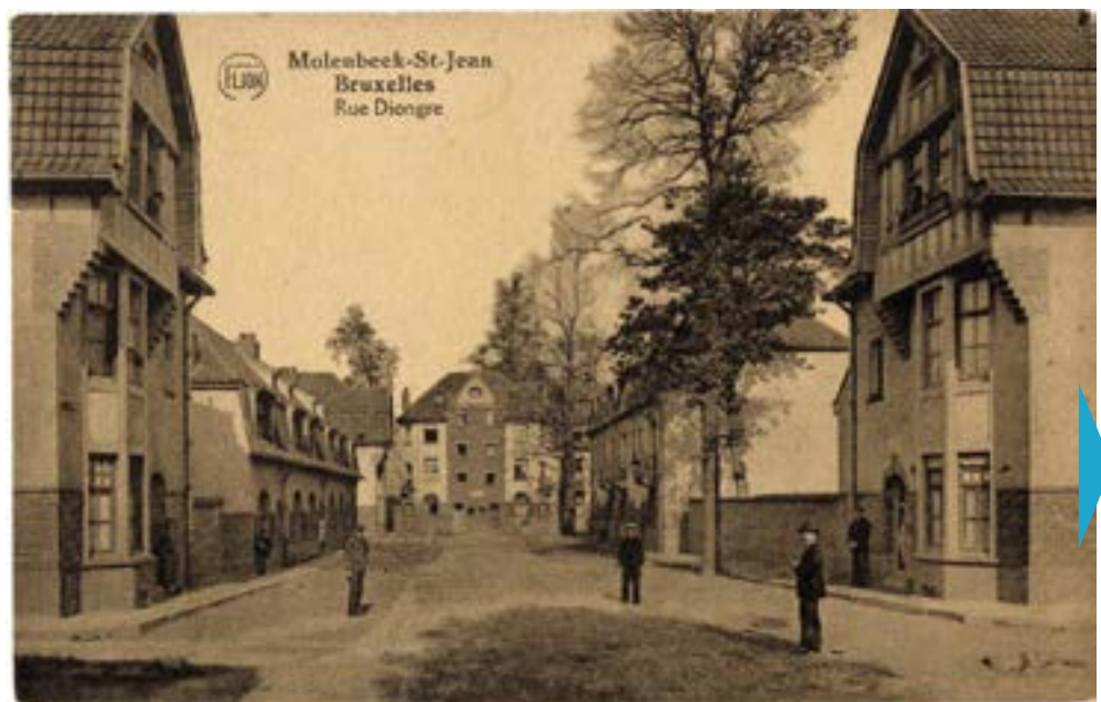
La Cité Diongre, carte-vue, 1922

partie de la population se traduit et se reproduit au travers des conditions de logement, particulièrement dans les quartiers densément peuplés où le bâti est ancien et ce, tant dans le parc résidentiel privé que social. Alors que les familles nombreuses sont surreprésentées à Molenbeek-Saint-Jean, les logements spacieux adaptés sont au contraire sous-représentés, ce qui engendre des problèmes de surpeuplement important dans les logements. Les familles les plus précarisées, souvent avec de jeunes enfants, sont concentrées dans ces quartiers affichant les loyers les plus bas de la Région, ou dans les quartiers de logements sociaux. » 3 Avec les conditions de vie de la population qui se sont détériorées au fil du temps, plusieurs associations ont commencé à travailler à