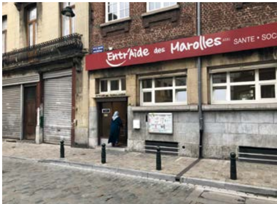
Au 169 rue des Tanneurs, l'Entr'Aide des Marolles est au coeur du quartier depuis 1931.